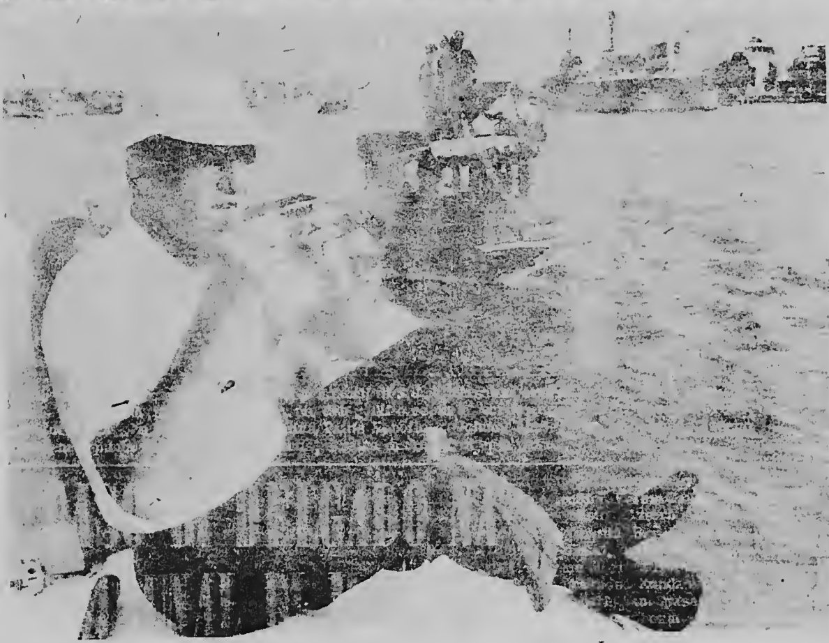
BANGKOK, THAILANDIA--Durante un sosiego den su gira pa sudeste di Asia, vice-presidente Hubert Humphrey ta actua como turista crusando e canal aki. E vice-presidente a combersa cu e oficialnan di Thailandia tocante e conferencia di Honolulu, y el a asegura nan e determinacion di Merca pa stop e agresionnan comunista na sudeste di ASIA.

nan di año 1963, qu ta trata riba e participacion financier- a di Hulanda pa ehecuion di e plannan di desarrollo economico, segun e miembronan di oposicion Gobierno Central a haña un auto- ridad qu no ta pertenecele, pa- sobra Gobierno Central no tin voz den e asuntonan financia- ra di e territorionan insular. Contrarrestando esaki, Gobier- no Central a muestra riba e Pro- tocol di Conclusion, qu ta basá riba Statuut y qu ta en completa acuerdo cu e autoridad qu Go- bierno Central tin den control di e placanen aki.